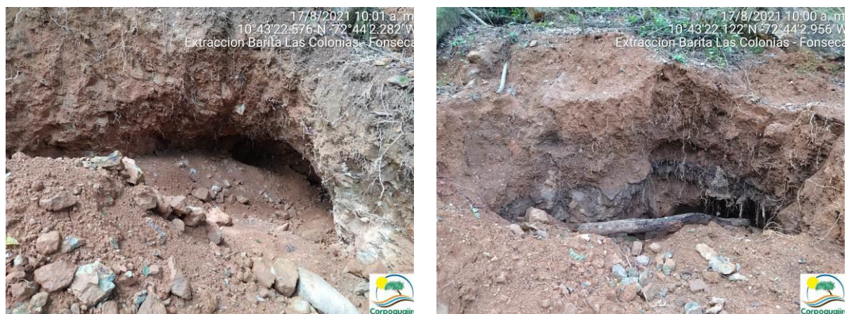
Fotografías No. 05 y 06. Extracción de Barita, creación de socavones en el terreno. 17 de agosto de 2021.

Evidencias fotográficas tomada el día 17 de agosto de 2021 por un profesional de Corpoguajira en la zona donde se viene realizando la actividad ilegal de extracción de Barita.