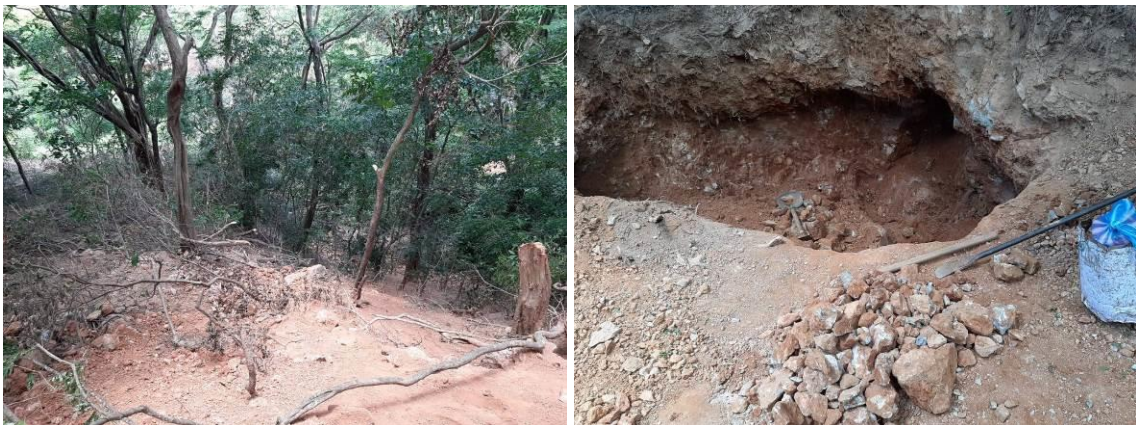
Fotografías No. 03 y 04. Extracción de Barita, creación de socavones en el terreno y tala de árboles. 09 de agosto de 2021..

Evidencias fotográficas tomada el día 17 de agosto de 2021 por un profesional de Corpoguajira en la zona donde se viene realizando la actividad ilegal de extracción de Barita.