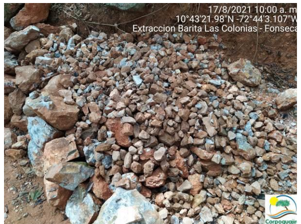
Fotografías No. 09 y 10. Mineral de Barita extraído de forma ilegal. 17 de agosto de 2021..