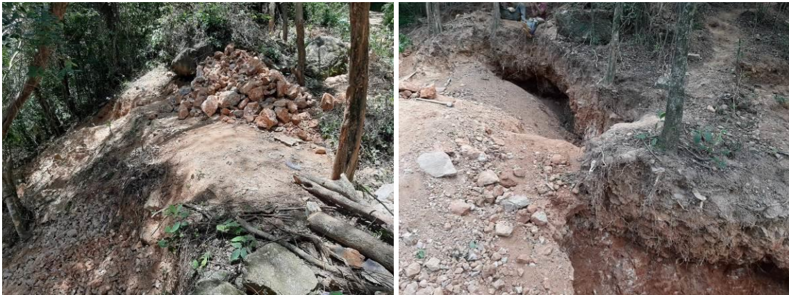
Fotografías No. 01 y 02. Extracción de Barita, creación de socavones en el terreno. 09 de agosto de 2021. (Fuente: Corpoguajira 2021).

Evidencias fotográficas tomada el día 09 de agosto de 2021 por un profesional de CORPOGUAJIRA en la zona donde se viene realizando la actividad ilegal de extracción de Barita.