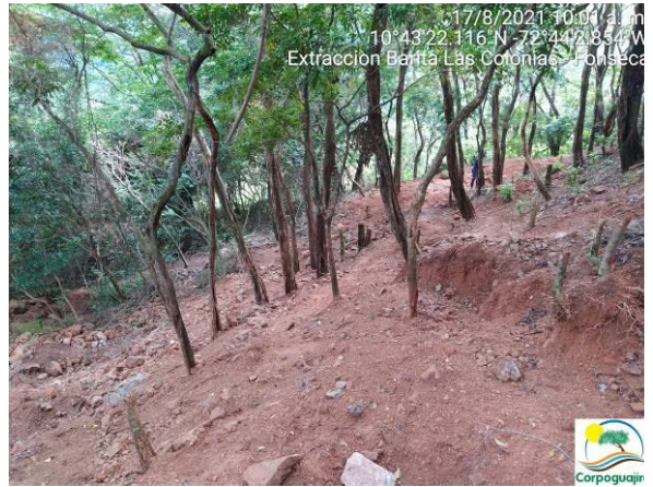
Fotografías No. 07 y 08. Tala de árboles para la extracción ilegal de Barita. 17 de agosto de 2021.