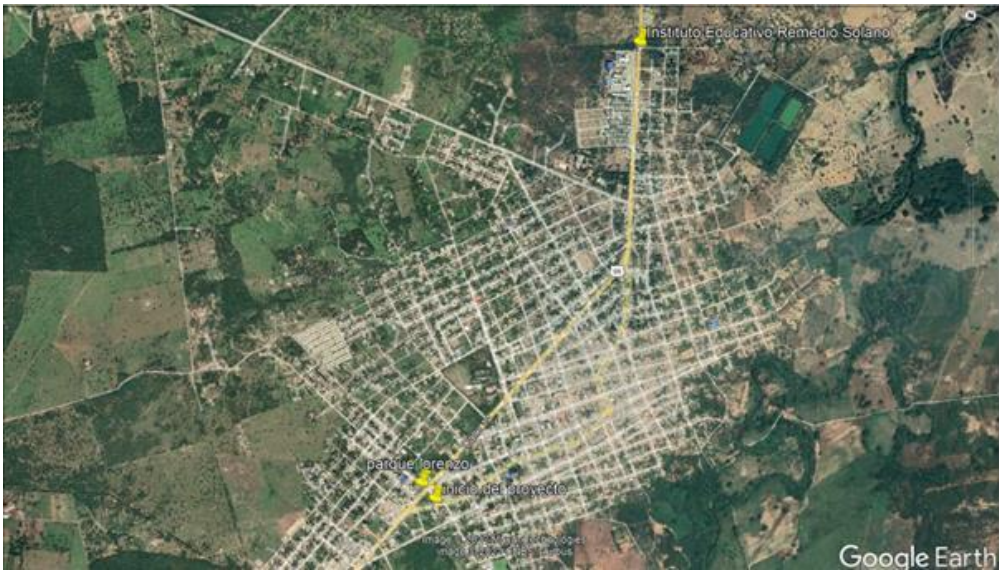
Fig. 1. Ubicación satelital de la ruta y zona de interés.