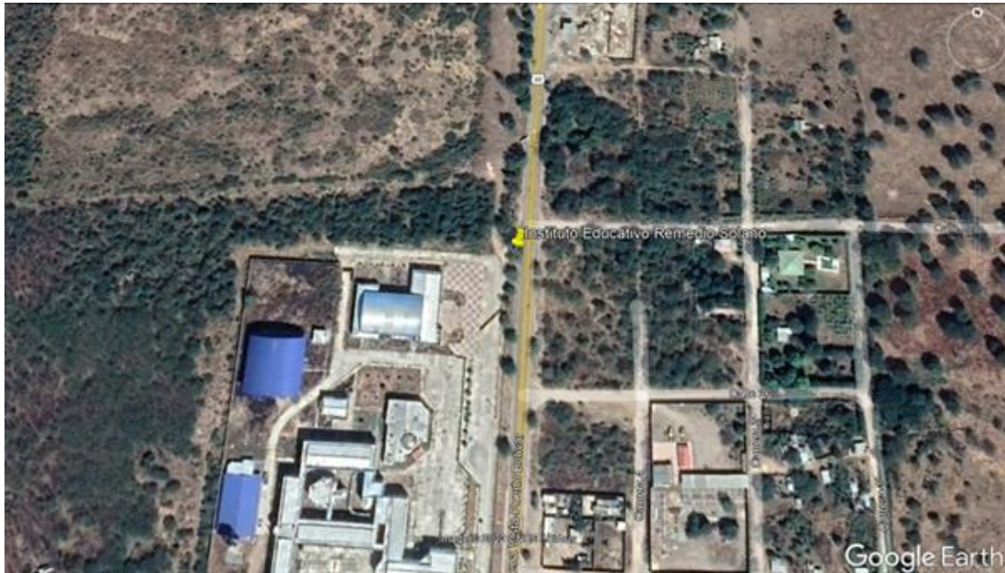
Fig.2. Ubicación satelital zona de interés.