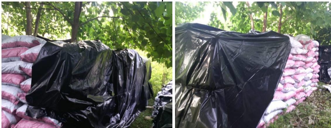
Decomiso de carbón vegetal acopiado en el predio Río claro