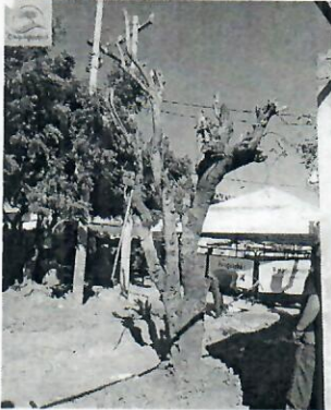
Fotografía 1 Matarratón 1