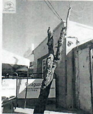
Fotografía 2 Matarratón 2