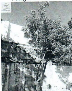
Fotografía 7 Neem 4