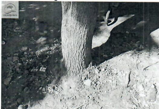
Fotografía 5 Raíz neem -2