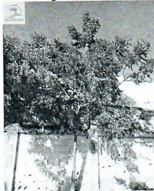
Fotografía 8 Neem 5