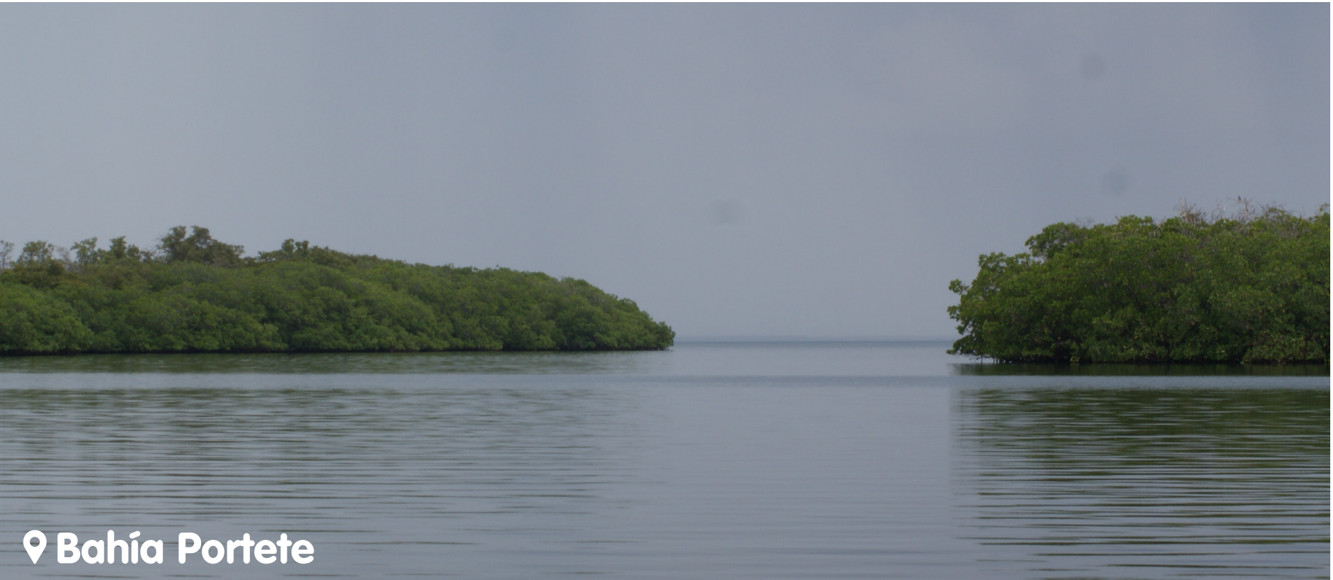
📍 Bahía Portete