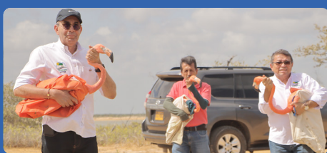
Liberados tres flamencos rosados rescatados en Bogotá