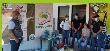
Con éxito avanza fortalecimiento de Bibliotecas Públicas con donación de ejemplares de educación ambiental