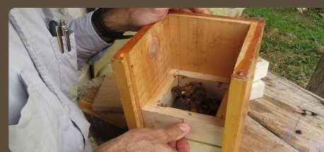
Corpogujira participó en encuentro de las CAR con ministra de ambiente designada, Susana Muhamad