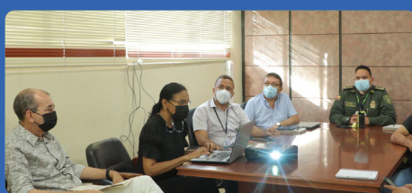
Acciones para conformar comité de manejo y control de abejas urbanas