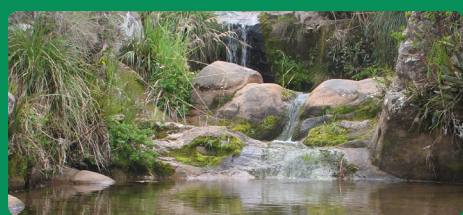
Corpogujira amplió el área protegida DRMI Perijá en más de 18.000 hectáreas