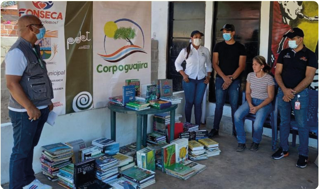
Documentación del SINA, del Ministerio de Ambiente y Desarrollo Sostenible. Adicionalmente, han sido facilitados por funcionarios de la Corporación.

Estos libros son, en su gran mayoría, donaciones del servicio de canje entre las CAR adscritas a la Red de Centros de