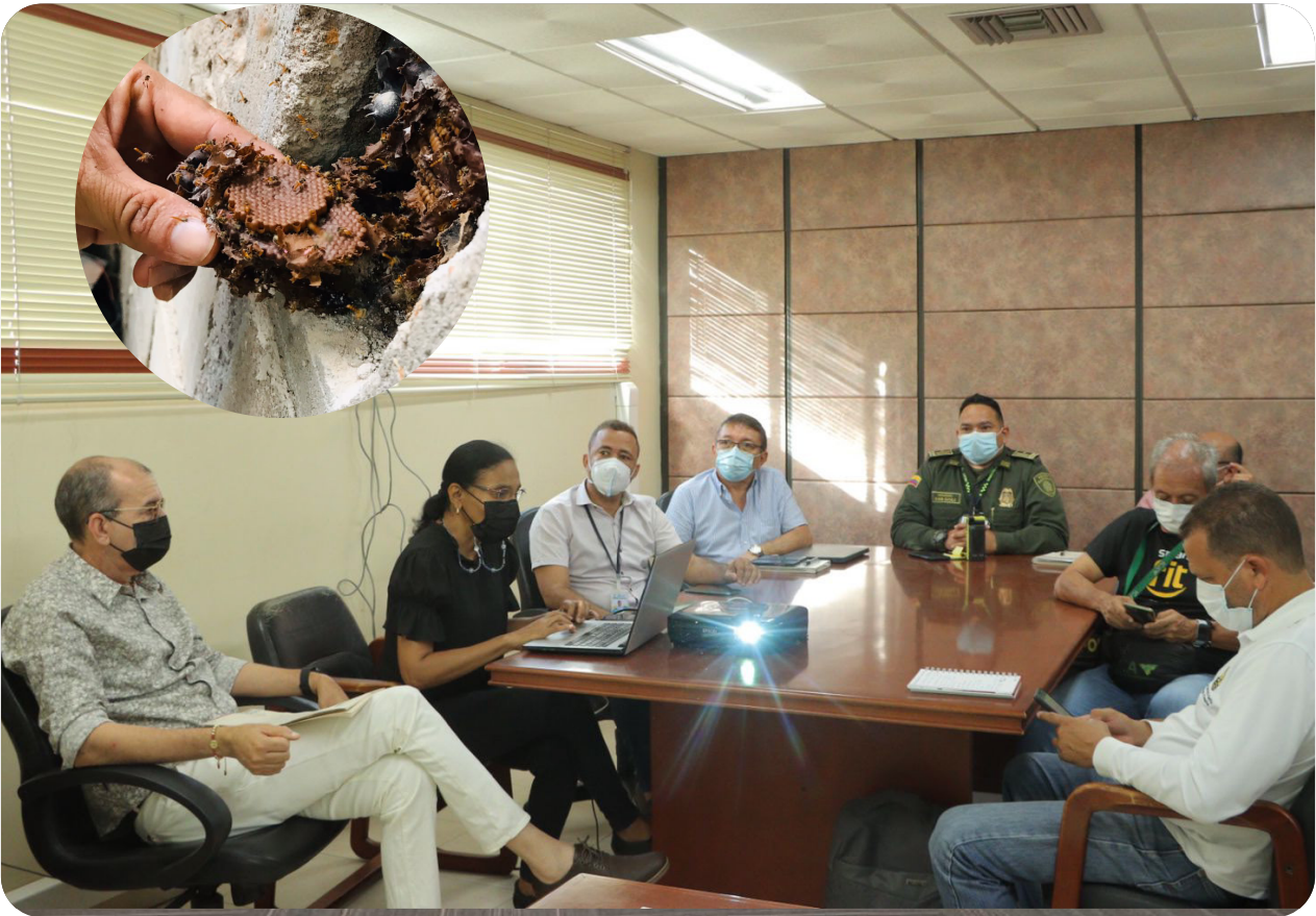
Corpoguajira viene ejerciendo un liderazgo que permita atender la problemática de abejas que se presenta en el departamento, causando molestias y afectaciones a la población civil.

Con el objetivo de mitigar el riesgo causado por las abejas africanizadas en el sector urbano, dar cumplimiento a lo dispuesto en la Ley 2193 del 2022 y fortalecer la apicultura como negocio verde, Corpoguajira adelantó una mesa técnica interinstitucional en aras de articular acciones que permitan seguir trabajando por la conservación y preservación de esta especie de gran importancia ambiental. En el encuentro estuvieron presentes funcionarios de la Gobernación de La Guajira, Alcaldía del Distrito de Riohacha, Cuerpo de Bomberos, Gestión del Riesgo, ICA, Procuraduría Ambiental y Agraria y Policía Nacional (Unidad de Protección Ambiental), quienes manifestaron su disposición en conformar un equipo de trabajo que disminuya el riesgo de ataques de abejas y donde prime la conservación de las mismas.