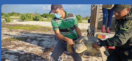
Cinco tortugas marinas fueron decomisadas en Maicao y liberadas en las playas de Mayapo