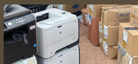
Cuatro toneladas de residuos posconsumo fueron recolectadas en La Guajira