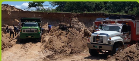
Con medida preventiva se suspendió extracción de material de construcción en Carretalito (Barrancas)