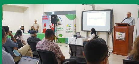
Corpoguajira lideró mesa técnica de erosión costera