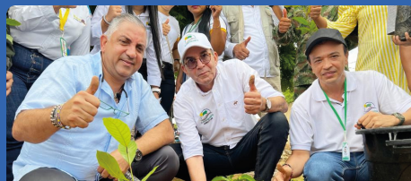
Con éxito se realizaron jornadas de sembratón en toda La Guajira