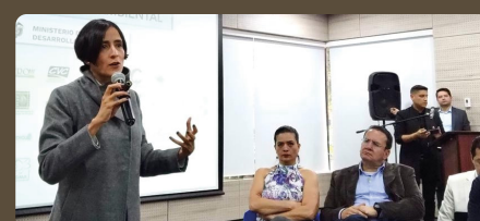
Corpoguajira presente en diálogo interinstitucional del Sistema Nacional Ambiental