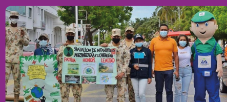
La Guajira conmemoró el Día de Educación Ambiental