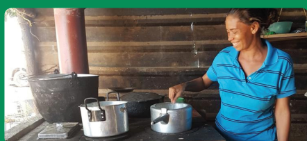
Corpoguajira lidera entrega de estufas ecológicas en cuatro municipios de La Guajira