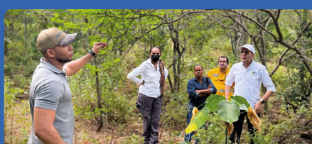
Con la siembra de 750 mil árboles Corpoguajira fortalece la recuperación de ecosistemas en Albania