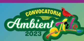
Convocatoria AmbientArte fortalecerá la educación ambiental en La Guajira