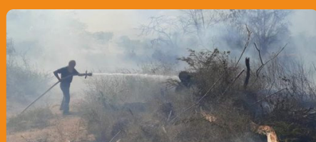
Por inicio de temporada seca Corpoguajira alerta sobre ocurrencia de incendios forestales