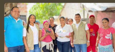
1.200 sacos de carbón vegetal fueron donados por Corpoguaijira a familias vulnerables de Fonseca y Urumita