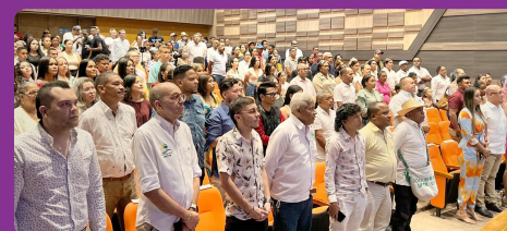
Convocatoria "Ambientarte" premió los mejores trabajos de educación y cultura ambiental