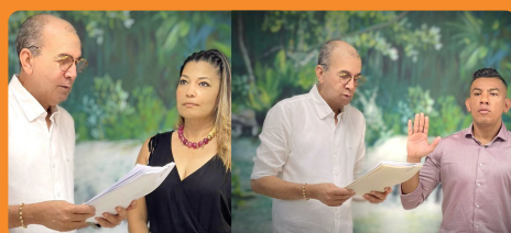
Director de Corpoguaijira posesionó a nuevo subdirector de Gestión Ambiental y asesora Jurídica