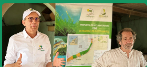
Minambiente y Corpoguaijira anuncian acciones para fortalecer la conservación del área protegida marina "Sawairu"

Los anuncios se hicieron durante una jornada de concertación realizada en el corregimiento de La Ahuyama (Uribia), la con contó con la participación de comunidades asentadas en las zonas aledañas al área protegida. La actividad hizo parte de la agenda de trabajo conjunta que adelanta el Gobierno Nacional esta semana en La Guajira. La reunión también contó con la presencia de delegados de Invermar, la Autoridad Nacional de Licencias Ambientales y la Autoridad Nacional de Acuicultura y Pesca.