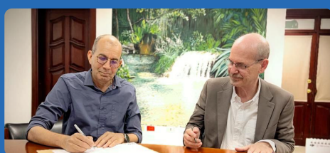
Corpoguaijira aúna esfuerzos con el Instituto de Ambiente de Estocolmo en pro de la gestión integral del recurso hídrico