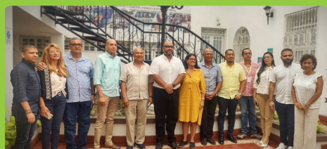
Corpoguaijira participó en encuentro: Por una región Caribe resiliente y biodiversa